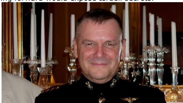
General James Cartwright during his military service

Israel's role in the cyber-sabotage of Iran's nuclear weapons development could hinder a leaks prosecution. On Wednesday, the Washington Post reported that the inquiry by the US government into whether James Cartwright, a retired general in the US Marines, leaked the information about the Stuxnet virus to The New York Times was stalled, among other reasons, over fears that moving forward would expose Israeli secrets.